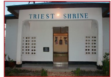
sanctuaire 'Triest Shrine', Tanzanie