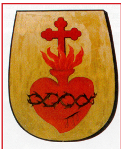
blason des Frères de Saint Jean de Dieu